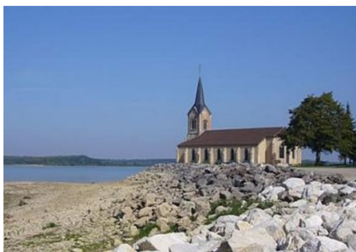
L'église de Champaubert-aux-Bois.

-----Le Lac du Der a nécessité des travaux pendant plus de 7 ans et sa construction nécessita la destruction de trois villages : Chantecoq, Champaubert-aux-Bois et Nuisement-aux-Bois ( voir photo ci-dessus ). Aujourd'hui, il n'en reste plus que l'église de Champaubert sur la presqu'île de Giffaumont-Champaubert, et l'église de Nuisement entièrement démontée puis remontée à Sainte-Marie-du-Lac-Nuisement. Le cimetière a également été déplacé.