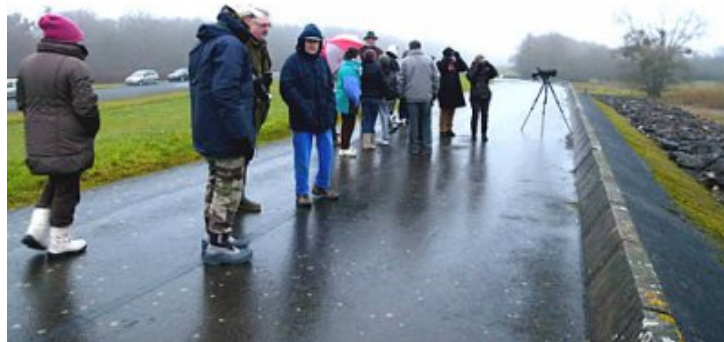
Le groupe sur la digue.

Une douzaine de personnes ont participé à cette sortie malgré le temps peu clément, accompagnés par un photographe animalier Jean-Pierre Formet.